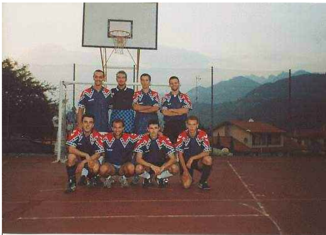
25L: La Grande Nazionale terza a Montemarenzo